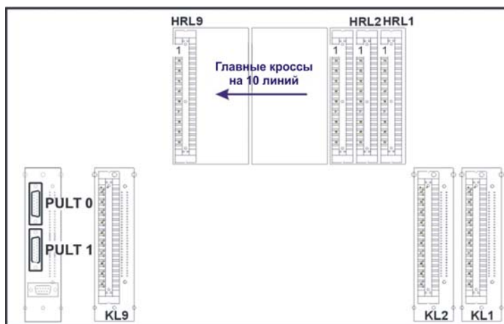
Рис.3.5. ALFA-ERACK-KR размещение разъёмов на задней панели (вид сзади).

HRL1 - HRL9 - главный кросс "ALFA-HLR-10" и защита от высокого напряжения "ALFA-PP0-10"